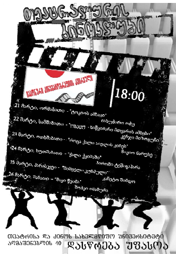
თეატრისა და კინოს სახელმწიფო უნივერსიტეტის არაპროფიტის 40 დასწრება უფასოა

საქართველოს შოთა რუსთაველის თეატრისა და კინოს სახელმწიფო უნივერსიტეტის აკადემიური საბჭოს დადგენილება